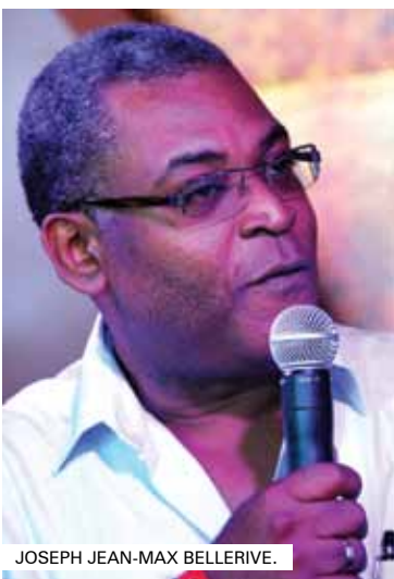
JOSEPH JEAN-MAX BELLERIVE.